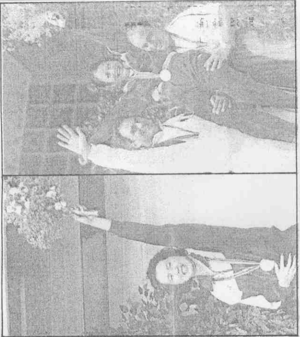
大陸金牌選手一覽表

有12金15銀5銅是由女選手所贏得，在金牌數上更佔了3/4的絕對比例，讓人不得不佩服大陸女將的奪金實力。 ●大陸代表隊在本屆奧運一口氣拿下16金22銀16銅，以老四的身份在巴塞隆納揚眉吐氣，在這54面獎牌中，可以明顯看出大陸體育陰盛陽衰、小比大強的趨勢。 說大陸的體育成績單陰盛陽衰，一點也不為過。在全部獎牌中，