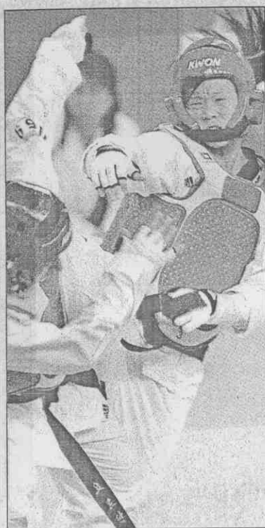
張瓊芳（右）昨天在亞運跆拳道女子62公斤量級準決賽，不敵韓國選手，圖為她在八強賽擊敗約旦選手。