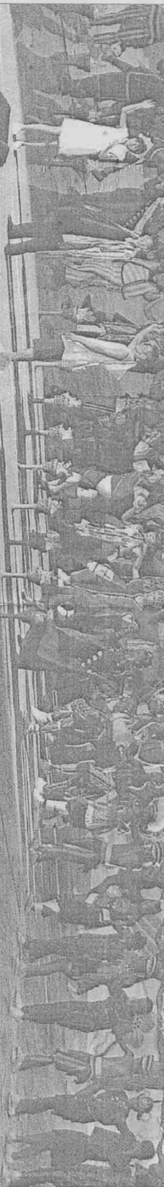
表領青帶美周夫人總統中演表「力量是我祈福」祈者，揮手致意，為台灣祈福。