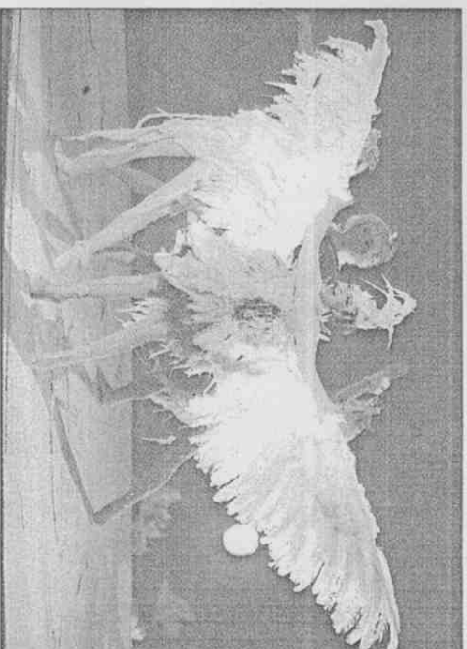
沒有到不了的地方 聽奧開幕典禮昨晚在台北登場，張惠妹穿著羽毛衣演唱聽奧主題曲「聽得見的夢想」。

【記者袁世珮／台北報導】五分鐘的演出，天后張惠妹像準備了一場演唱會，所有的緊張、壓力、恐懼，對造型的挑剔、唱現場的堅持，只為了能如天使般，從四十公尺高處，帶著歌聲，飛抵聽障奧運開幕典禮舞台。