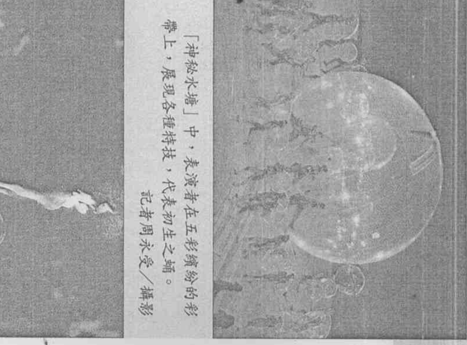
「神秘水塘」中，表演者在五彩繽紛的彩帶上，展現各種特技，代表初生之蛹。