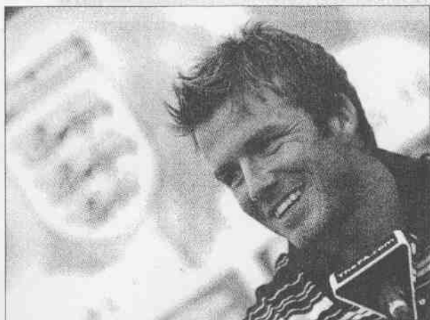
▲英格蘭足球隊長貝克漢在記者會上談笑風生，他被球迷選為「世界足球先生」。