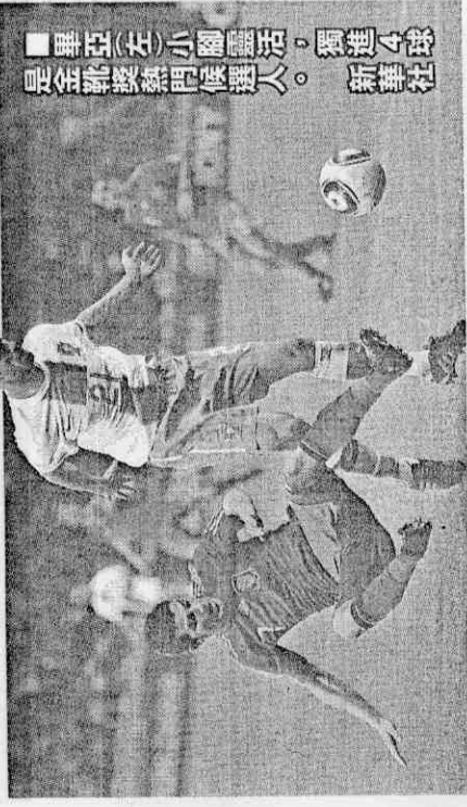
■畢亞(左)小腳靈活，獨進4球是金靴獎熱門候選人。