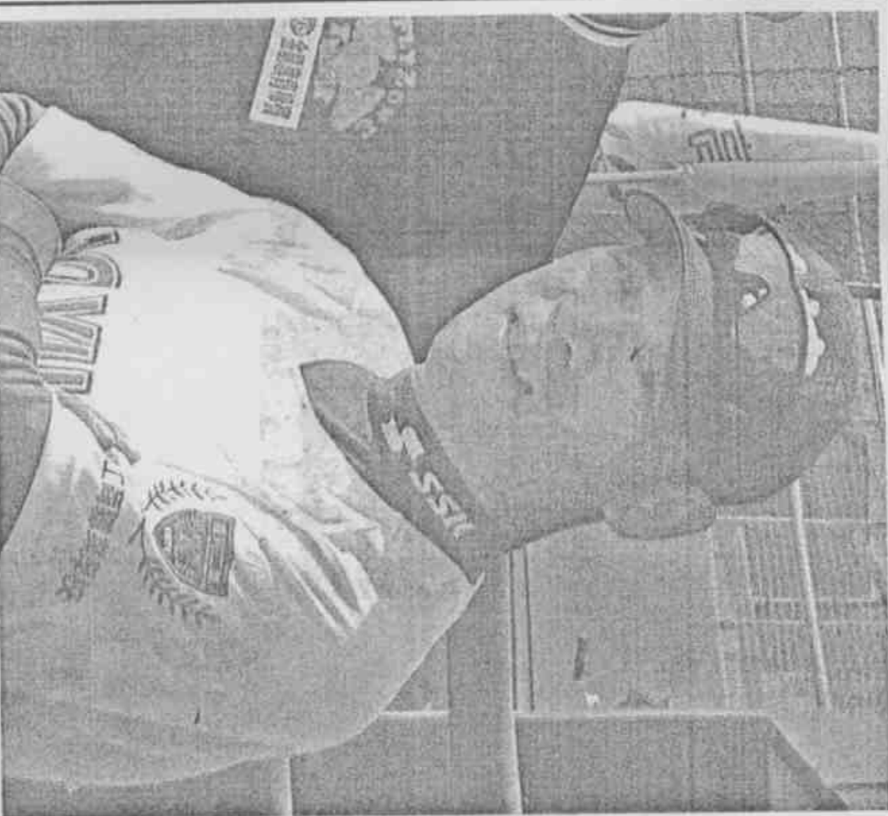
李來發表示，扎根三級棒壇是他長久以來強調的重點，與政府的目標不謀而合。

【記者彭華台北報導】時間回到卅六年前，美國羅德岱堡球場人聲沸騰，比賽還沒開打，備飽加抽的嗓子就快喊破了！李來發與高英傑這對來自台灣的棒球「黃金搭檔」，一捕一投完封對手，他們無敵的神話，震驚美國棒壇，各大媒體爭相報導，不能相信他們竟是用補過的球和打到凹凸不平的球棒，這歷克難拿下世界青棒大賽冠軍！ 李來發球員生涯戰績彪炳，八年與高英傑一同加入日本職棒南海鷹隊，旅日四年後返回台灣擔任教練，擔任過職棒球隊總教練，也帶領國家隊參與無數國際大賽，一九九二年率中華隊取得巴塞隆納奧運銀牌，更是生涯的最高峰。