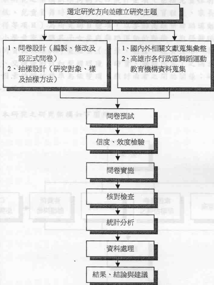
圖 3-1 研究程序流程圖