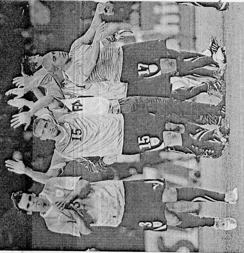
▲烏拉圭隊失利後，全隊在場中無奈的接受戰事費。