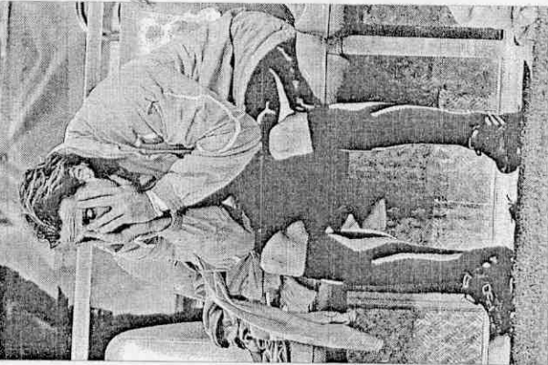
▶烏拉圭隊攻擊心佛蘭因傷提前退場，他在場邊失神的望著球隊落敗。

年美國世界盃，高達359萬人次進場；其次是上一屆德國世界盃的336萬人次。南非本屆還有3場比賽要踢，約可達到320萬人次。