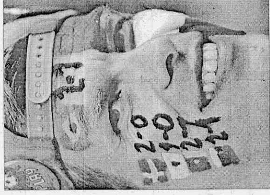
▲死忠荷蘭球迷把橘衫軍在南非世界盃的每場賽事結果彩繪在臉上，提醒大家荷軍的成績。