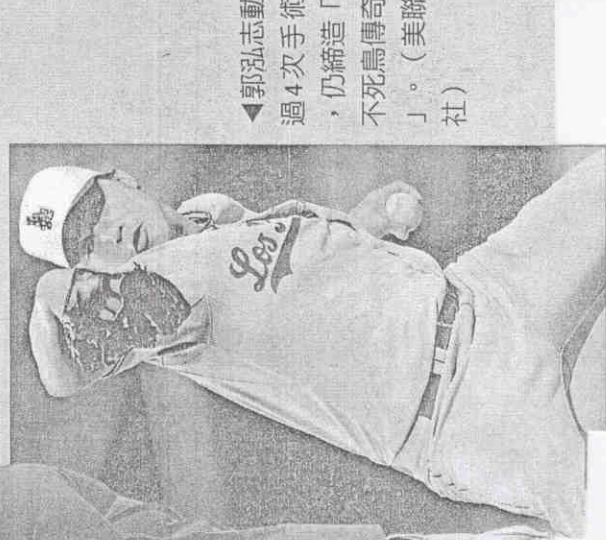
◀郭泓志動作過4次手術，仍締造「不死鳥傳奇」。

獲第五名。其後他逐漸退出運動場，曾在左訓中心任職，培養出古金水、李福恩等好手。一九八三年當選國民黨籍平地山胞立委；後來也曾代表民進黨參選台東縣長失利。最後在家鄉闢建「玉璽宮」，自任廟祝與乩童達二十年，二〇〇七年在美國中風病逝。