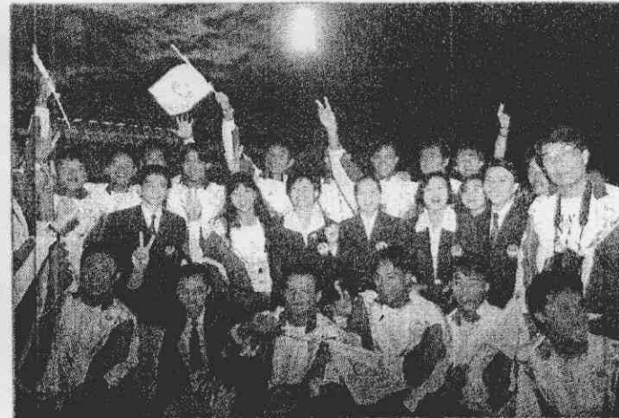
↑海峽兩岸的選手，在世大運閉幕式中一起高興的合影。