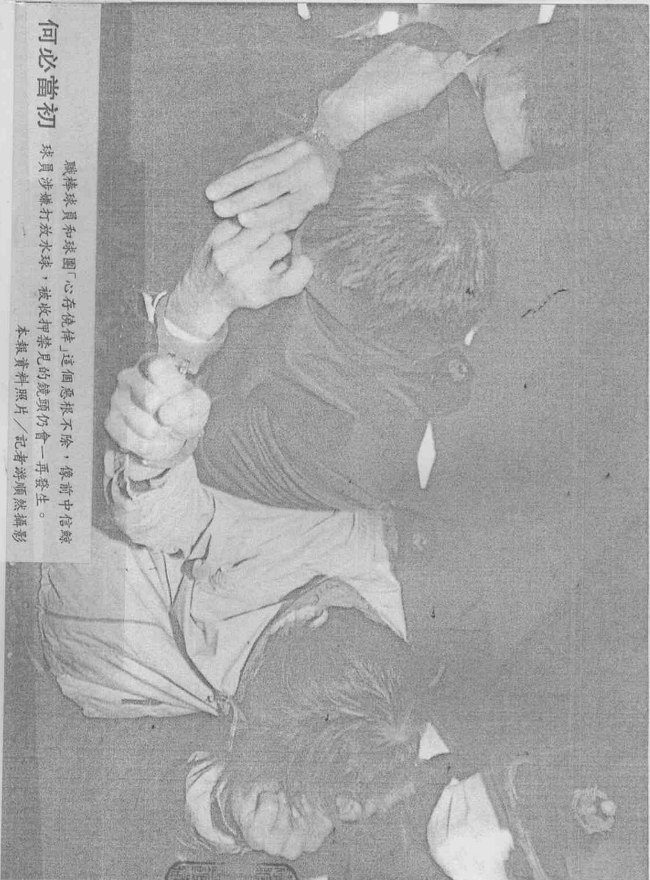
職棒球員和球團「心存僥倖」這個惡根不除，像前中信鯨球員涉嫌放水球，被收押禁見的鏡頭仍會一再發生。