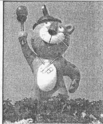
利多虎「物祥吉運奧城漢」▲

●「虎多利」憨態可掬的向全世界運動員招著手，定今年九月十七日揭幕的一九八八年漢城奧運，不負它這隻吉祥物的魅力，吸引了一百六十一個國家報名參加，創下奧運會與賽國數的最高紀錄。尤有甚者，美、蘇兩大強國的運動冷戰，也將在漢城奧運會場宣告結束。 漢城奧運的報名截止日期是格林威治時間一月十九日廿三時（台北時間一月二十七日七時）。當蘇聯在十一日宣布將派一支五百名選手組成的代表隊參加漢城奧運時，漢城奧運籌委會搖盪已久的不安之心，頓時獲得「歸位」，因為蘇聯的與會，表明