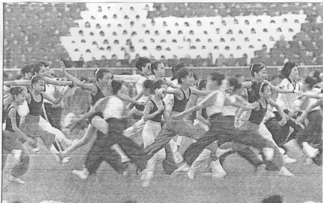
曼的L代時躍飛 3 出跳，盈輕姿舞童學班蹈舞小國↑ ○奏節妙