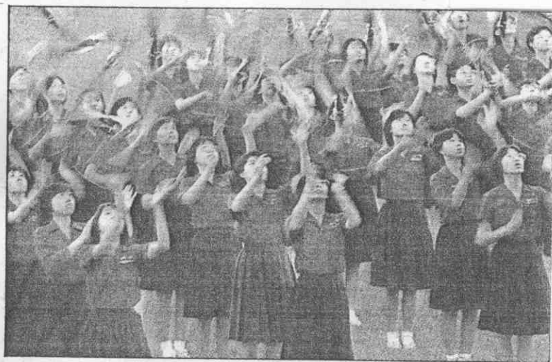
止觀為嘆人令，槍操式花隊儀女一北的邇遐聞名 ↑ ○足十感美，出演式方蹈舞俗民以L傳相火薪 ↓