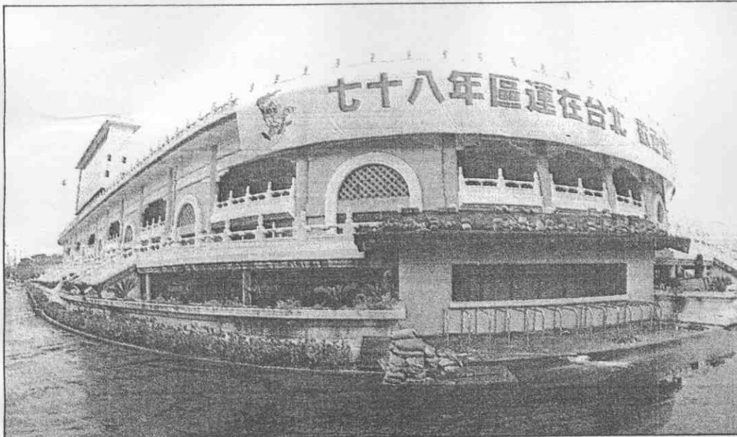
(攝興福張 者記報本)。條布「台北在運區」掛高已，上牆外式典古的場球足山中市台北↑

●在工程人員連夜趕工下，我國第一座具國際標準的專用足球場——台北市立中山足球場，歷經六年的興建工程延宕，以及三年的施工之後，終於要在今年（廿一）日宣布啟用。 由於整個球場尚差小部分（百分之五）未完工，因此，市政府今天並不將之視為球場的落成典禮，但足堪做為這次台灣區運比賽使用。中山足球場也是今年台北市辦區運，耗資最鉅的硬體設備，高達三億六千三百五十萬元。