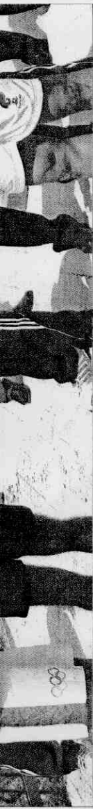
▲擔任希臘境內聖火傳遞第一棒的希臘跆拳道國手亞歷山大·尼克拉迪斯(右)將火炬傳遞給中國游泳女將羅雪娟(左)，開始聖火傳遞任務。