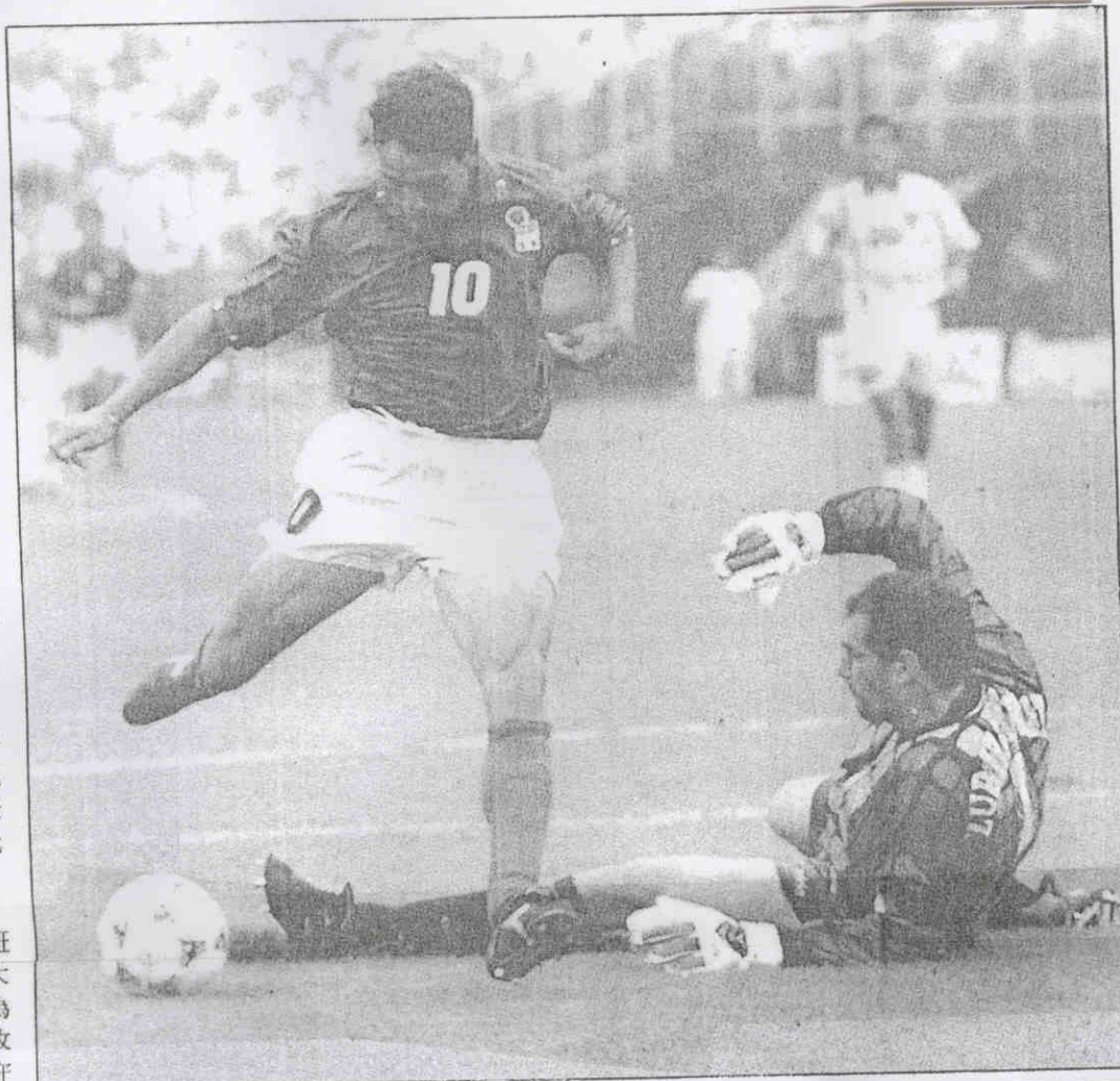
↑巴吉歐(左)越過西班牙門將蘇比沙瑞塔，起腳踢進致勝的一球。

依然不了解為何沙利納斯會失手。夢為之幻滅。西班牙隊自知錯失此役，良機恐怕不再，全隊沮喪不已。