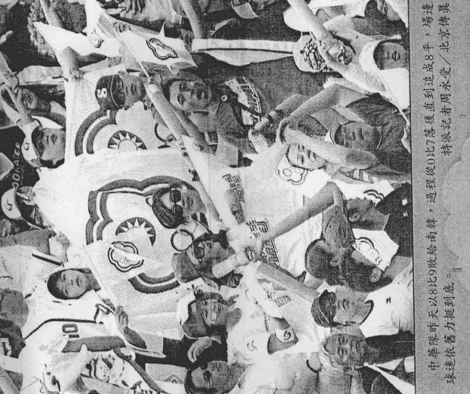
中華隊昨天以8比9敗給南韓，過程從0比7落後直到追成8平，場邊球迷依舊力挺到底。