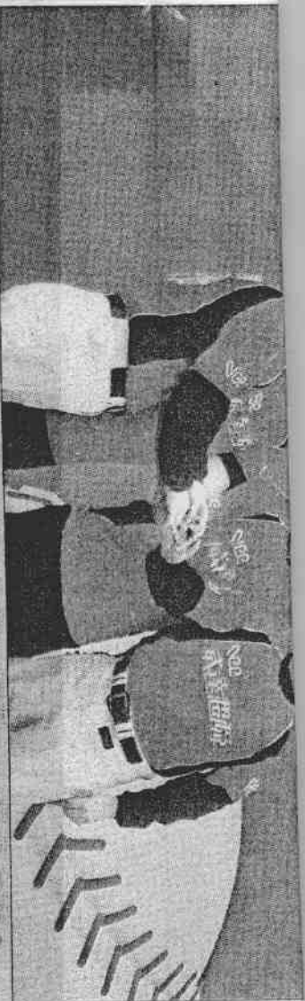
▲中部地區企業贊助的威達超舜成棒隊，運作情況不在職業球隊之下。