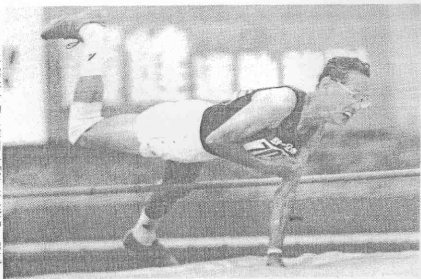
年逾七十的江倬用手「撐」著跳高，勇氣可嘉。