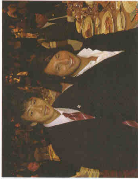
這可是澳洲的魚雷索普

當起了演員拍攝起廣告，除此之外，積極推動〈健康體育護照〉概念，更大力投入〈推廣女性肺癌防治〉宣導活動，和母親擔任起最佳的活動代言人，2005年更獲得民生報-十大運動員獎。不論是在比賽當中，或是面對社會需要奉獻一己之力時，他總是認真而執著。