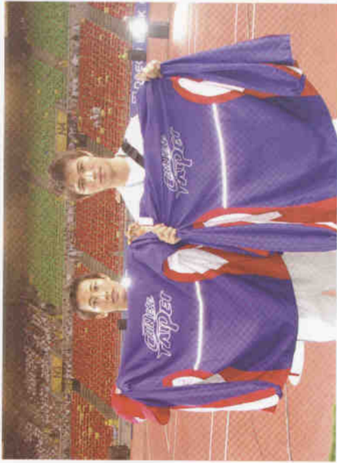
2003世界大學閉幕時跟大學同學留影

開始是因為父親爲了不讓他浪費時間，另一方面，父親也希望讓他有個可以紓發體力的地方，但是在慢慢接觸跆拳道後，也開始對跆拳道產生了