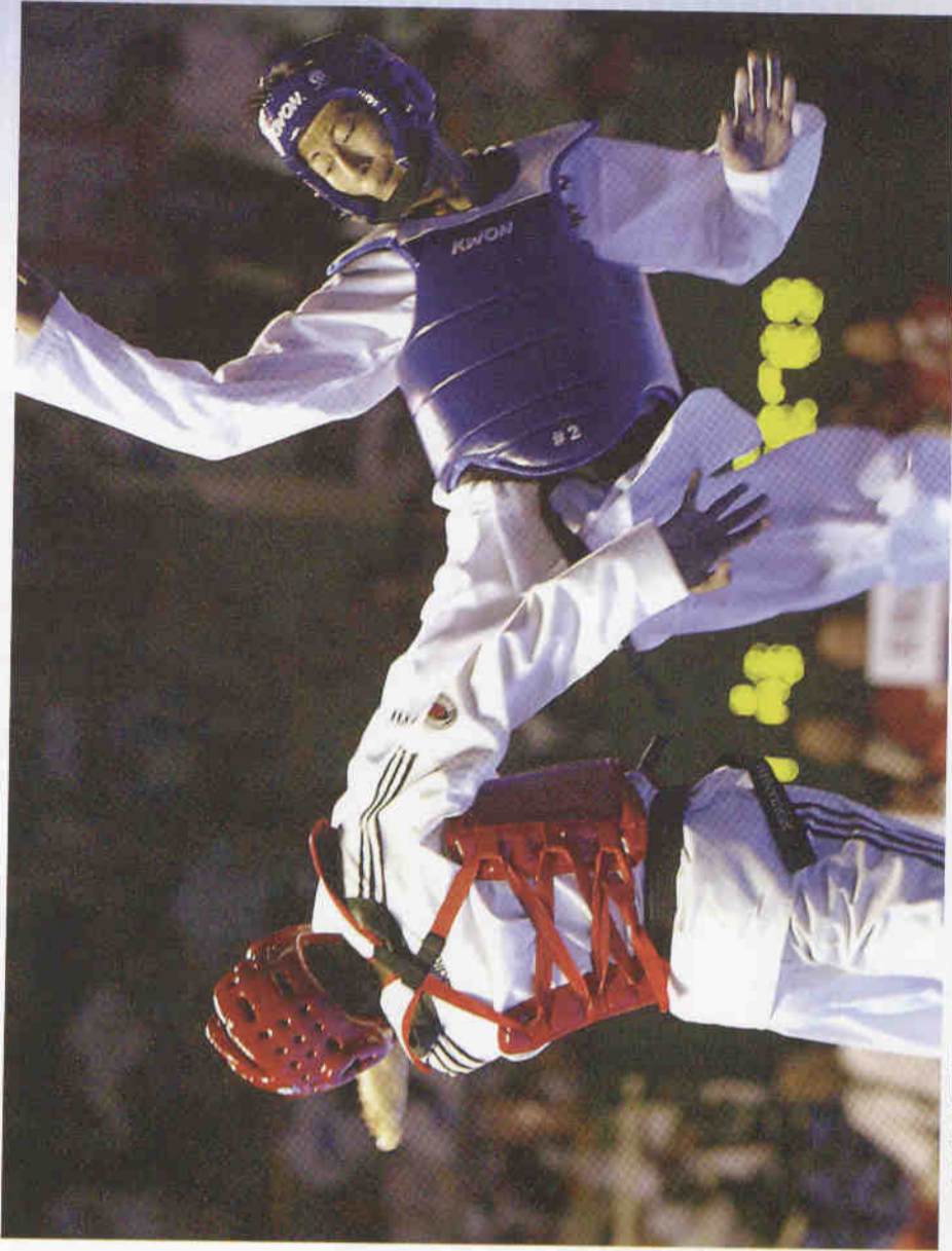
2002年釜山亞運，朱木炎後旋踢英姿。

在朱木炎以優異之勢獲得奧運金牌時，台灣也因為體育傑出表現再次站上國際的舞臺向世界發聲。而世界跆拳道聯盟主席-金雲龍稱他爲「世界跆拳道30年來首見奇才」也因爲他的緣故讓更多的國際人士認識台灣，當朱木炎在奧運頒獎台上說出：「I am form Taiwan」時，是多麼令人動容的一刻，那裡是運動的殿堂，體壇世界的中心，而台灣已在那裡留下了。