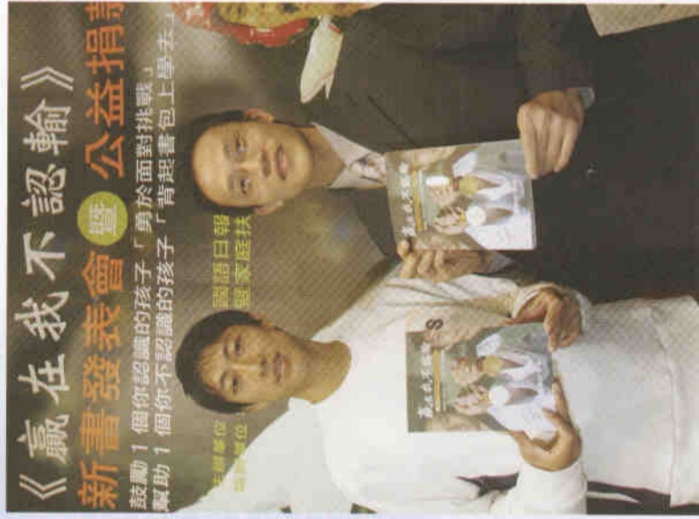
《贏在不認輸》新書發表會暨公益捐贈活動。