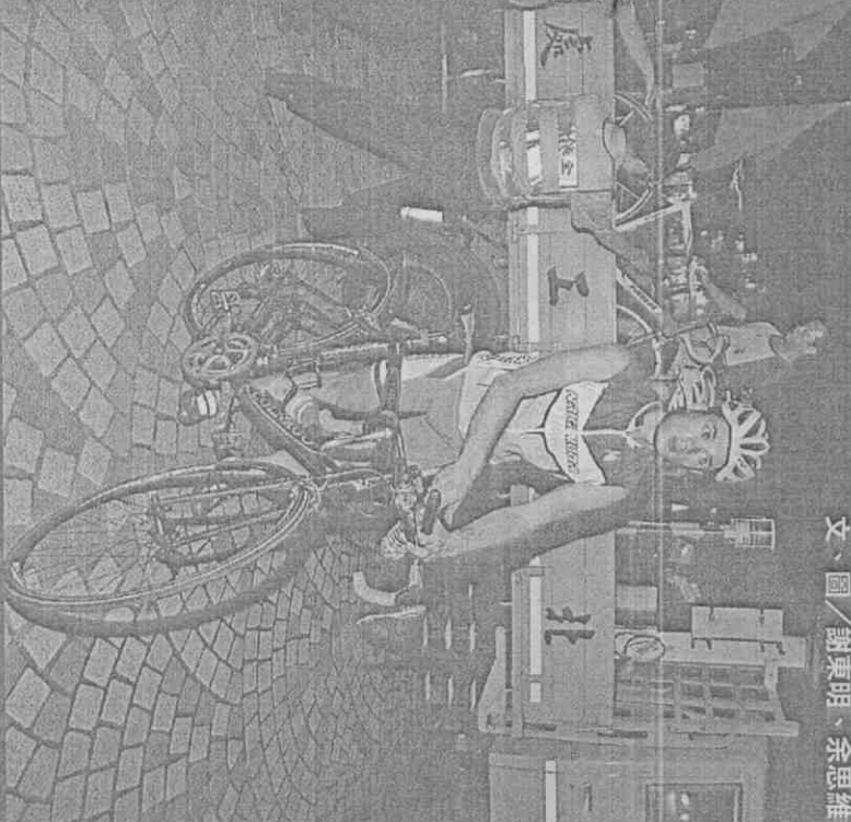
文、圖/謝東明、余思維

4名穿著全身專業車衣的聽奧俄羅斯自行車選手，昨晚6時許練習時誤闖國道三號，還排成一排在高速公路上下輪車，駕駛人猛按喇叭，因4人根本聽不到，警方緊急將他們帶回警局，但警察不懂手語，選手又聽不到，雙方比劃半天，最後以簡單英文筆談，聯繫車隊聯絡人，並將選手人、車安全護送回下榻的酒店。