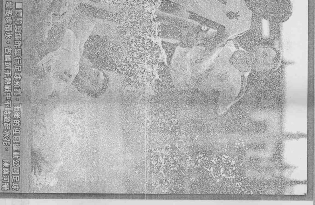
聽障奧運昨舉行足球預賽，雨後的迎風運動公園足球場多處積水，各國選手熱戰中不時激起浪花。

聽奧是專為聽力障礙者設立的奧運級綜合運動會，參賽運動員須經聽力檢驗，較優的一耳聽力損失達55分貝以上才有資格。選手大多肢體健全，僅聽力受損影響平衡感跟反應，整體水準和各單項業餘運動員相去不遠，因此聽奧競爭性