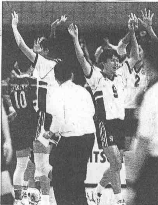
◀中華男排逆轉勝日本隊後，球員興奮雀躍。

右，前排兩側重砲轟得日本不知所措，每記扣殺又高又重，日本隊伸長了手攔網，也只能沾到球的邊邊，他狀況好到連隊友都覺得不可思議。