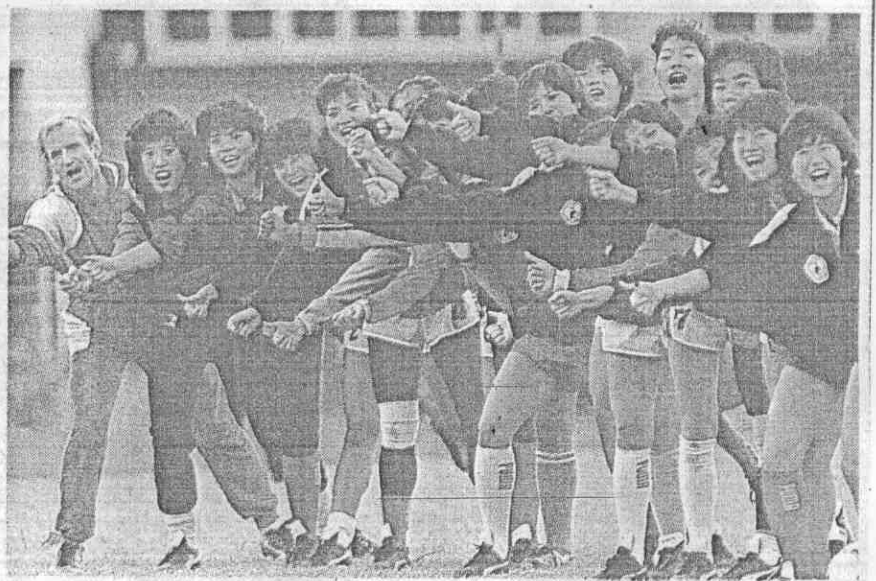
(攝興福張 者記報本) 球傳角三練動們女隊洲澳：左。影合後球完練員隊蘭木的虹如氣士：右。綿秀王衛後左隊蘭木着揹爾梅斯冠練教的隊蘭木華中：上右

【本報訊】一九八七年世界女足邀請賽，今天下午二時，將在台北市立體育場揭開戰幕，四大洲的九十支女足勁旅角逐，中華木蘭隊將在揭幕賽中迎戰玻里尼亞亞隊。 開幕當天，上屆的冠、亞軍勁旅西德與中華木蘭隊，便雙雙亮相，木蘭是在三時半對玻里尼亞亞，接著在五時，由西德出擊日本隊。明天開始至十三日分組預賽，分別在台北市及鳳山中正體育場舉行。 本屆角逐的十隊，共分三組循環預賽，各取前兩名晉級六強循環決賽，A組為上屆冠軍西德、美國及日本。上屆這三隊也分在同組，結果是西德與另一隊澳洲出線，這次美國與日本隊的實力增強，美國首次以國家隊參賽，受人矚目。 西德仍是被看好可以出線的隊伍，另一名額由美、日互爭，這一組戰況將很激烈。B組有中華木蘭與上屆第四名紐西蘭、玻里尼亞亞隊，木蘭與紐西蘭將會出線。 C組有四隊中華良玉、澳洲、加拿大及香港，競爭也將很激烈，澳洲國家隊是去年大洋洲杯女足的亞軍，曾擊敗紐西蘭；而加拿大首次組國家隊來華，實力也受人注意，兩個出線權，將是中華良玉與澳、加之爭。 明天台北市無戰事，焦點在鳳山中正體育場進行的C組四隊之爭，下午二時中華良玉將出戰澳洲，三時半，由加拿大對香港。 預賽之後，十五日起決賽在北部舉行，每天有二場，第一場在板橋台北縣立體育場，第二、三場在台北市立體育場比賽，另外在鳳山還有第七至十名的名次賽。 大會將在廿日全部落幕，足協委請各家採訪女足的記者，選拔十一名大會的明星球員，並與本報配合猜誰是女足冠軍的有獎徵答活動。