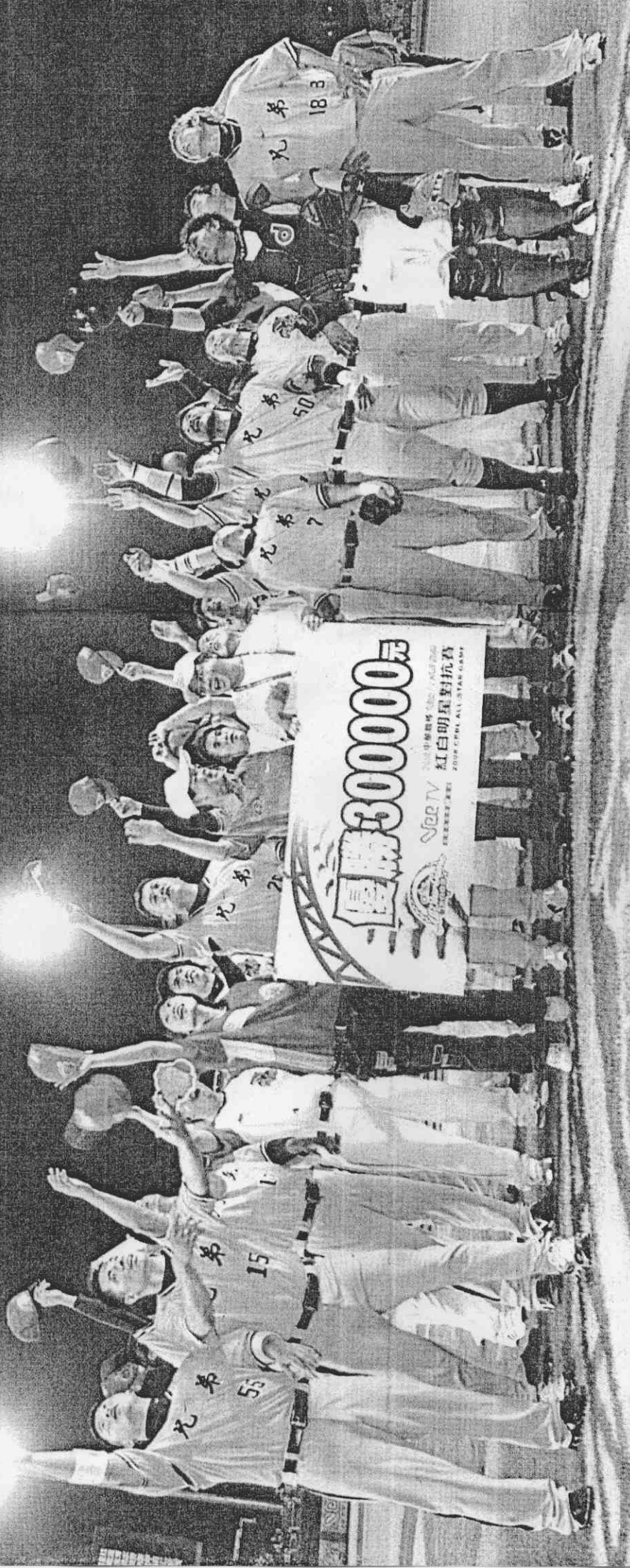
明星紅隊贏得比賽，抱回30萬元獎金，球員們拋高球慶祝。

〔記者鄭又嘉／台中報導〕1萬4066名球迷，在炎熱的夏夜湧進台中洲際棒球場，為的就是中華職棒的仲夏夜饗宴：明星賽，他們並沒有失望，因為戰況與氣氛比天氣更熱，以奧運「遺珠」為主的明星紅隊，靠著6局下的絕地反攻，10：6擊敗明星白隊，拿下明星賽的5連不敗。 由下半季目前排名4到6名，而且合註只有2名奧運選手組成的明星紅隊，