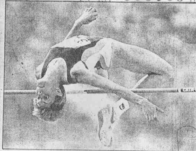
保加利亞女將柯絲塔狄洛娃三日以二公尺〇五獲得女子跳高金牌。

金牌總數累積到十面，比先前最佳成績八年前的漢城奧運多了四面，而男子馬拉松比賽將在四日舉行，非洲仍有繼續奪冠的可能。七面田徑金牌、兩面游泳金牌，