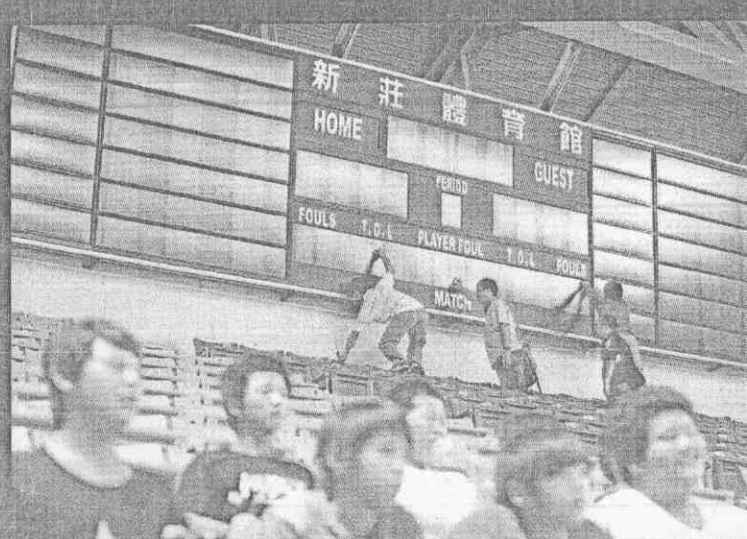
瓊斯盃比賽最終日，新莊體育館計分板一度故障，工作人員緊急搶修。