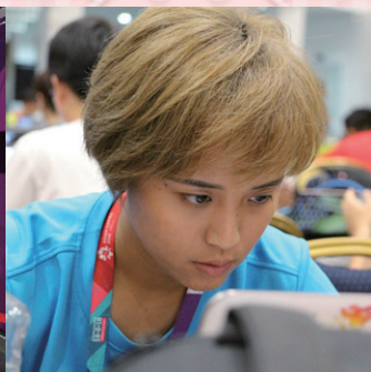
要完成一則新聞採寫，臨場反應與文字能力十分重要