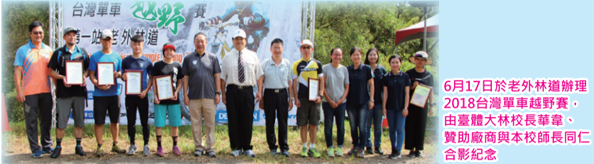
6月17日於老外林道辦理2018台灣單車越野賽，獲大體大校長蔣華、贊助廠商與本校師長同仁合影紀念

●6月17日在臺中老外林道辦理「2018台灣單車越野賽」，約有300位選手與觀眾參加，本賽會獲得巨大機械工業股份有限公司、迪卡儂、RST、Shimano、CONTROLTECH、驛采整合行銷股份有限公司等單位贊助，活動圓滿成功。本賽事獲得第三名的江勝山選手，更於2018雅加達亞運會自由車男子登山車下坡賽項目奪得銀牌，成為我國隊史上第一位亞運登山車下坡賽奪牌的男子選手。 ●暑假期間在臺中、宜蘭地區舉辦三梯次「2018臺灣大&美利達單車DIY夏令營」活動，課程內容包含自行車器材介紹、車組裝、自行車道生態旅遊等活動，藉由這些多元的活動內容，讓學員開心的認識自行車相關介紹，學到團隊精神、自信與獨立，藉此提升健康運動風氣，活動圓滿成功。 ●為使新生充分了解系所特色、教學主軸、未來就業方向及本系相關教學事務介紹，特於8月22日辦理碩士班新生座談會，期許未來系所學生更有凝聚向心力。 ●9月16日在體操館辦理系友盃排球活動，以增加學生之團隊榮譽，促進系友與學弟妹間之情感，並提倡校園運動風氣，從運動競賽中學習運動家精神。