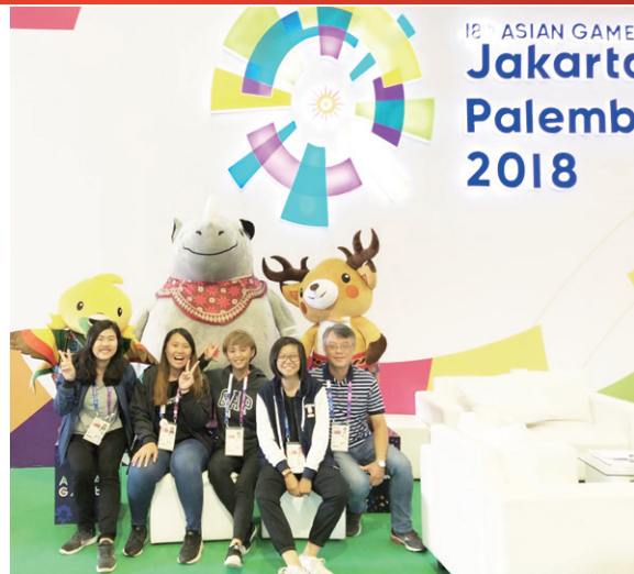
臺體運傳系尖兵闖亞運在雅加達新聞中心體驗採訪

為保持運傳系之競爭力及招生優勢，未來如果能得到學校更多資源，如場地、設備的支援，運傳系在運動新聞製播之領域，應能繼續保持在各大專院校的領先地位。