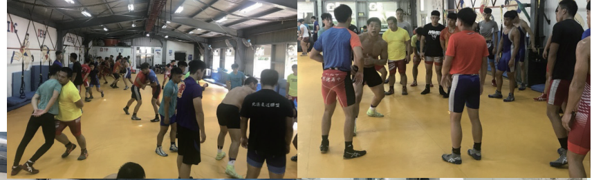
實戰技術訓練以及模擬比賽