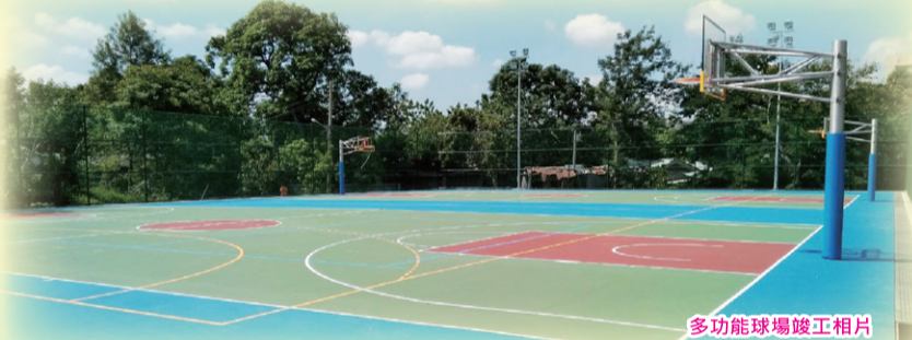
多功能球場竣工照片

●運動科學綜合大樓（長啓樓）室內裝修工程：目前進行圖書館一、二樓裝修及五樓階梯教室講台座椅安裝，預計9月25日前完工。另電腦教室、機房、運科中心實驗室及研究室等均已完備採購並移交相關單位人員使用。 ●多功能球場新建工程：位於力行路男生宿舍旁，工程經費1000萬元，於2月1日開工，6月完工驗收移交體育室設施管理組管理使用。