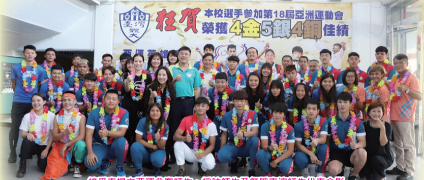
接受表揚之亞運參賽師生、採訪師生及舞蹈表演師生代表合影

●9月10日起受理學生弱勢助學計畫-助學金及生活助學金之申請，請符合資格尚未申請者，於10月20日前提出申請，以免影響權益。 ●9月19日召開107學年度第1學期社團負責人會議，佈達社團共同規範事項。