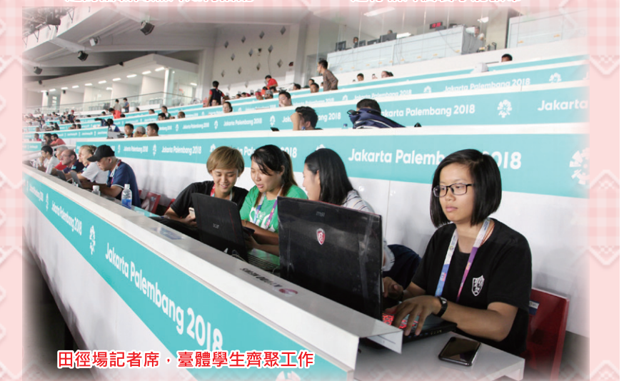
田徑場記者席，臺體學生齊聚工作