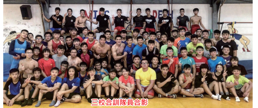
三校合訓隊員合影

訓練課程為期五天，選手將近百人一同參與訓練，除了一般體能以外，還有專項體能、重量訓練以及角力實戰技術組合訓練與模擬比賽訓練等，訓練與模擬比賽交替進行，特別著重在「耐力」、「體能」、「技術」層面上。本次透過與其他學校交流，使選手在技術層面與施做技術的信心上有所提升，也藉寒暑假間的長期移地訓練增進學校之間的友誼，觀察各高中的優秀選手，期盼其繼續升學就讀本校，為本校爭取佳績。