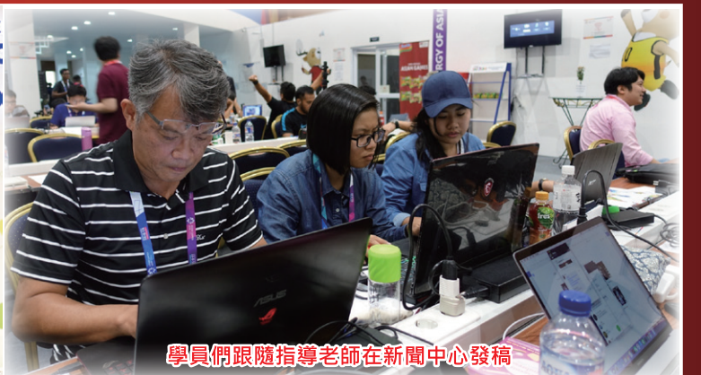
學員們跟隨指導老師在新聞中心發稿