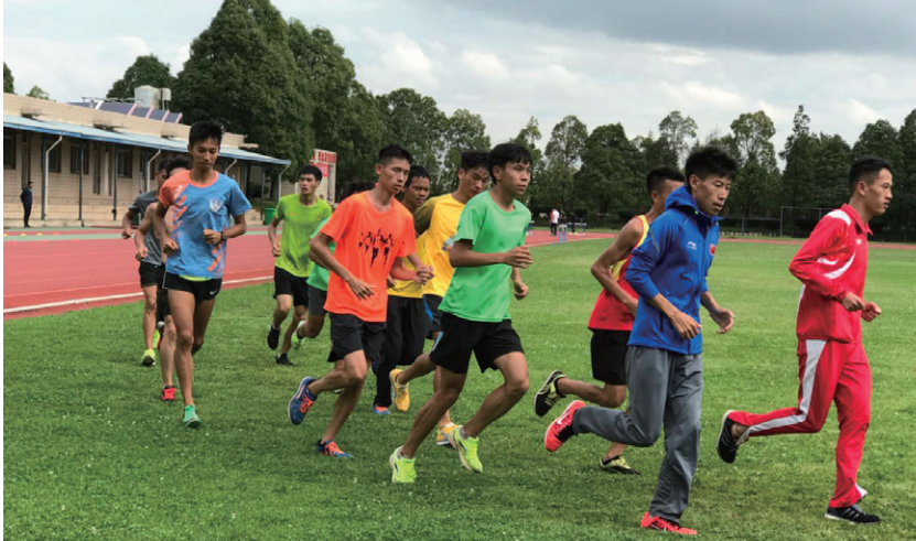
雲南省呈貢體育訓練基地