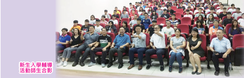
新生入學輔導活動師生合影

●9月14日於田徑場簡報室舉辦107學年度新生入學輔導活動。 ●9月22日於田徑場簡報室辦理期初系會活動。 ●9月29日由中心學生會舉辦迎新活動。