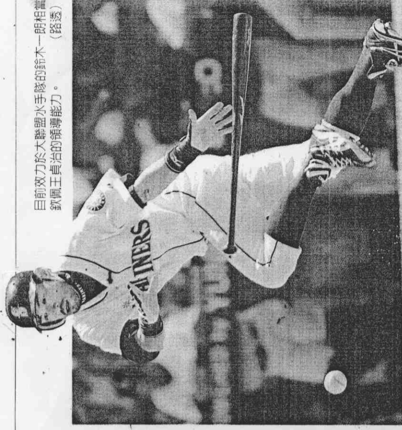
目前效力於大聯盟水手隊的鈴木一朗相當欽佩王貞治的領導能力。

但是練球時仍然有一位低年級的小朋友拿著紙筆衝進場內，只見王貞治抱起小朋友，並請翻譯告訴他，現在正在練球，沒有辦法幫他簽名，等練完球再幫他簽，這個動作讓人看到王貞治溫暖、親切的的一面。