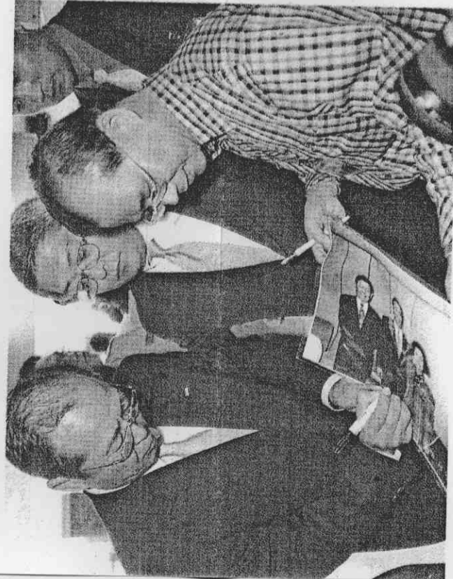
王貞治（左）當年率日本職棒總冠軍大榮鷹隊來台，親切的幫台灣球迷簽名留念。

台灣護照也曾經為王貞治帶來一些不方便，像是1963年球季後法國航空招待日本職棒兩聯盟冠軍隊教練和最有價值球員前往歐洲旅遊，王貞治就因此進不了當時已和中華人民共和國建交的英國。1992年王貞治以球評身分前往巴塞隆納奧運，原本打算順道到葡萄牙一遊，但是因為簽證不好辦而放棄；不過王貞治從沒有為「方便」的理由而考慮歸化日本籍。