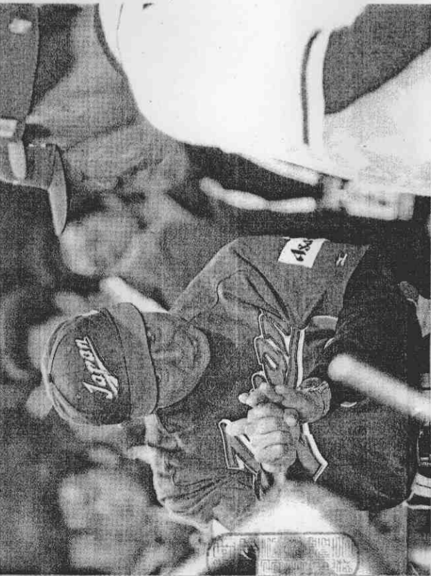
王貞治在2006年世界棒球經典賽前，與台灣隊教練團交流經驗。