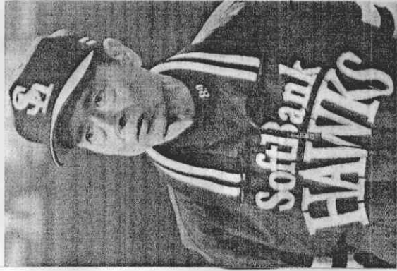
王貞治帶著生涯868支全壘打的紀錄，以及超過半世紀對棒球的貢獻，光榮退役。