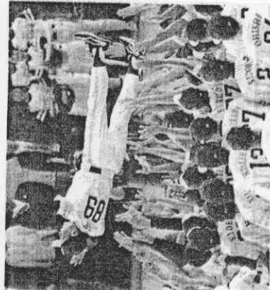
王貞治當年率領大榮鷹隊，拿下日本職棒總冠軍。

1980年40歲的王貞治打擊率下滑到0.236，但仍有30支全壘打和84分打點，球季後藤田元司接替長島茂雄擔任巨人隊監督，藤田邀請王貞治擔任副監督，王貞治雖然覺得自己還能打，