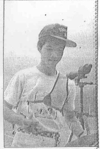
↑陳進明人小志向大。