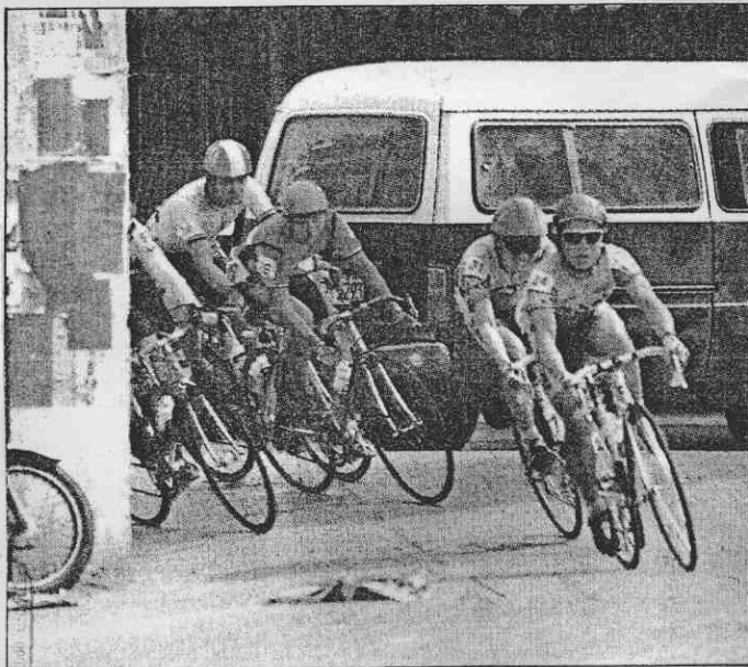
↑進入頭份市區的轉彎死角，使選手不得不減速慢行。 →龍潭部分路段佈滿碎石，造成不少選手摔傷。

●國際自由車環台賽第3站台中至阿里山的172公里登山賽，今天上午10時在中興大學門前鳴槍出發。