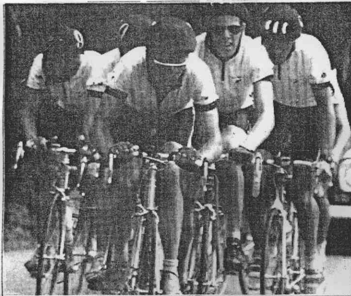
耐力與毅力。 →關西的坡道很能考驗自由車公路賽選手的 在第1領先集團，直抵終點。 ←紐西蘭隊成功運用團隊戰術，隊中5人全