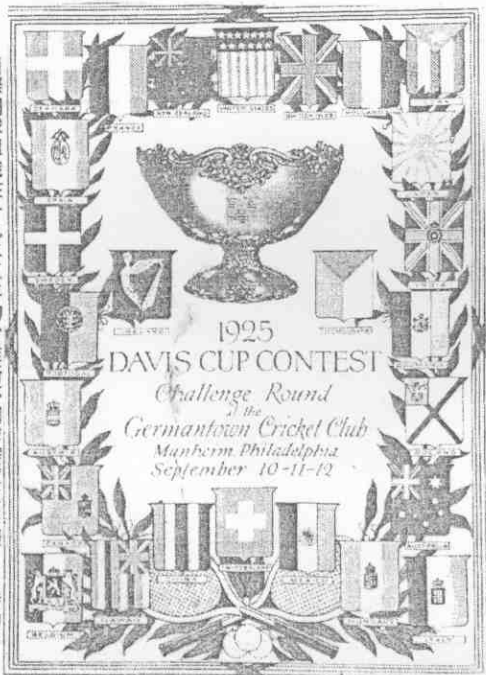
國際網球組織在一九二五年的台維斯杯網球賽宣傳海報，當時的中國國旗（下排左三）是北洋軍閥的五色旗。