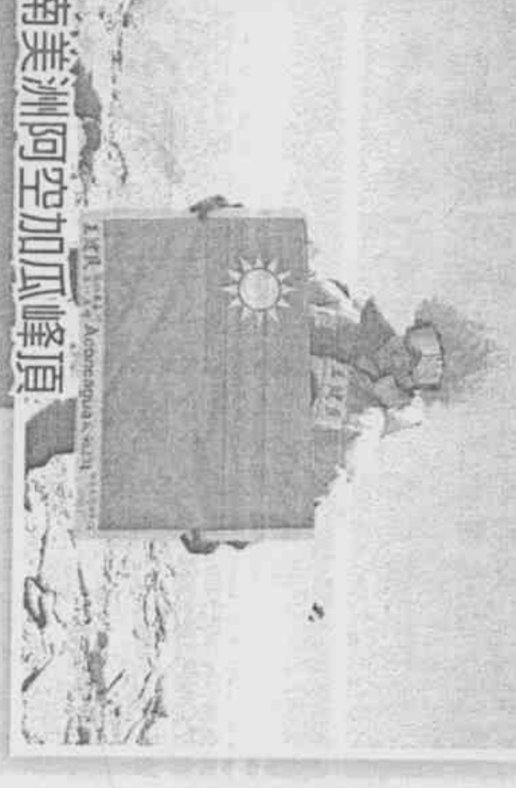
南美洲阿空加瓜峰頂