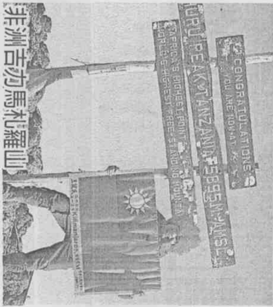
非洲吉力馬札羅山