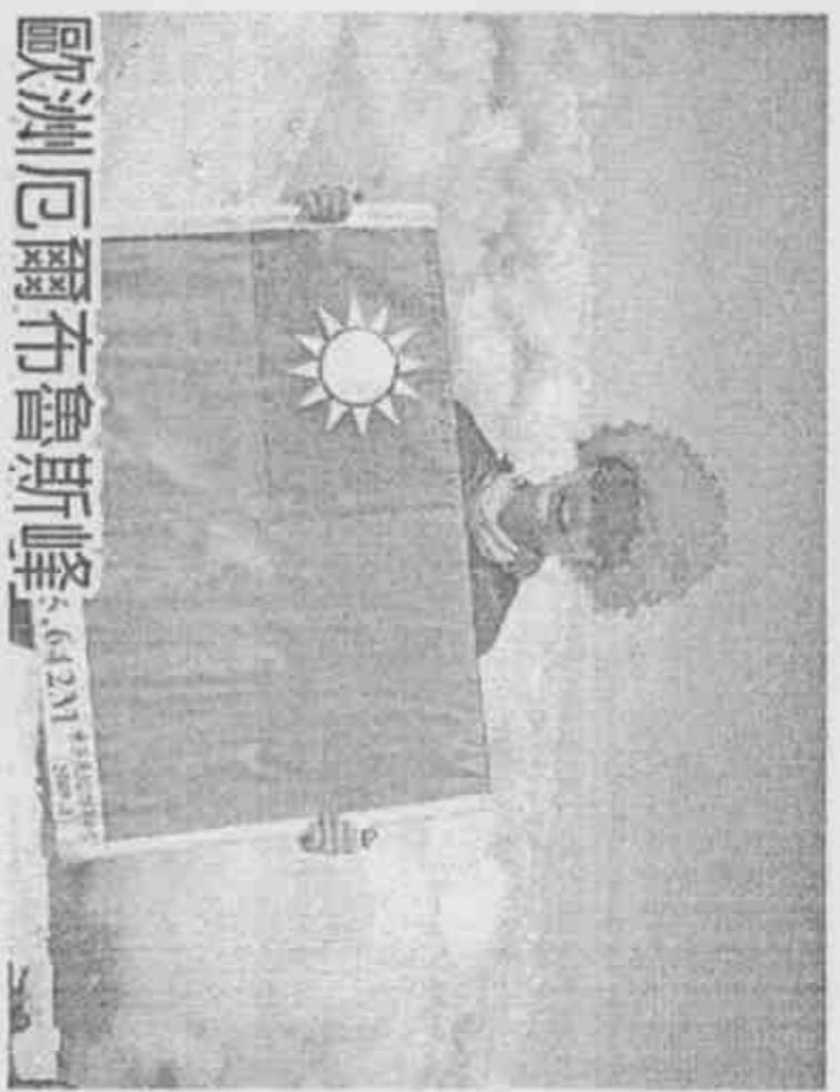
歐洲厄爾布魯斯峰