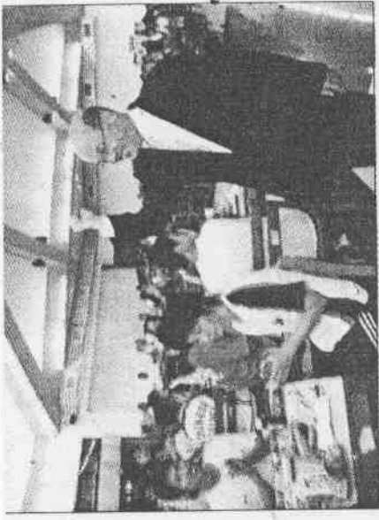
▲行政院長蘇貞昌(右)昨天在國訓中心與亞運代表團共進晚餐，並鼓勵選手力創佳績，為國爭光。