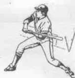
甲組資格賽 棒球挑戰賽

【本報訊】晉升甲組的棒球挑戰賽，北體隊繼前天以二比四敗給三商隊後，昨天又以〇比十提前在第六局被統一隊擊敗。今天下午二時在台北市立棒球場，將由三商隊再向北體挑戰，如果三商獲勝，即