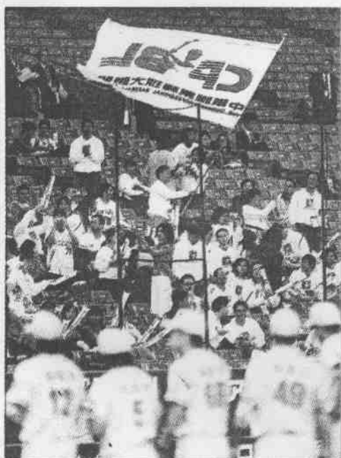
→興農牛6:0完封大陸明星隊贏得首勝，球迷揮動大旗慶賀。