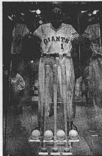
↑王貞治的球衣、球棒等，陳列在東京巨蛋的職棒名人堂中。

然高達33%，職棒固有30%不錯的成績，卻不得不心驚膽跳，同時市面的運動專業雜誌，足球雜誌從一本暴漲至八本，棒球雜誌則從四本衰退到一本，真不能同日而語。