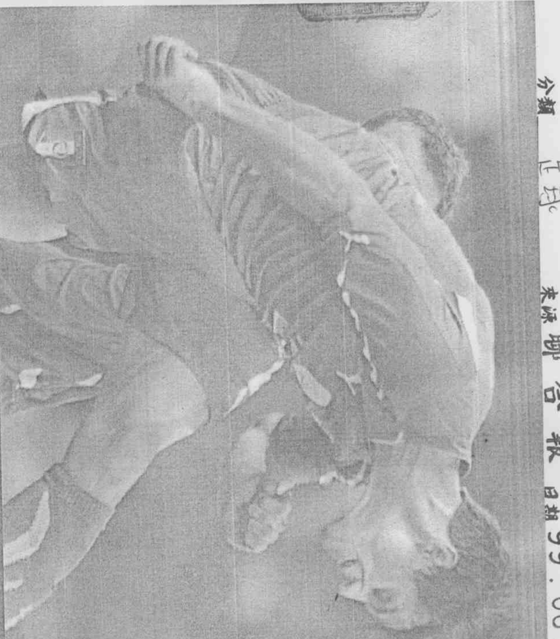
義大利馬吉歐在與瑞士隊進行熱身賽時，奮勇以頭槌化解危機。