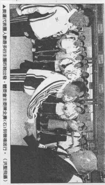
▲奧運代表團人數最多的主團昨晚出發，體委會主委陳全壽(右)到機場送行。

上送行親友，華航櫃台前更擠滿了人潮，許多出國民眾還拿相機搶拍選手們拍照索取簽名，讓選手們備感榮耀。