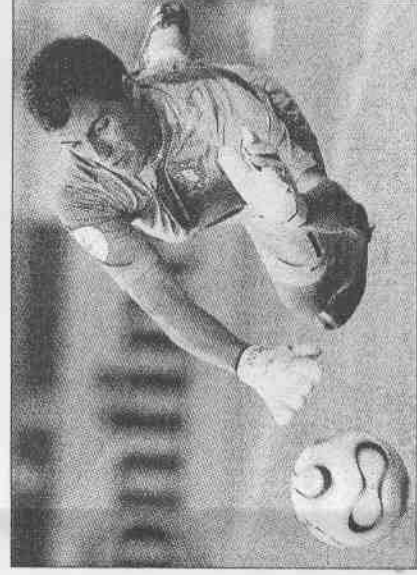
▲葡萄牙守護神西卡多奮勇撲出英格蘭三個12碼罰球，賽後高興地振臂高呼。