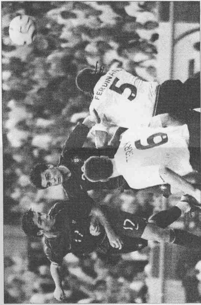
▲葡萄牙小羅納度(左)頭槌準確，爆發力十足。