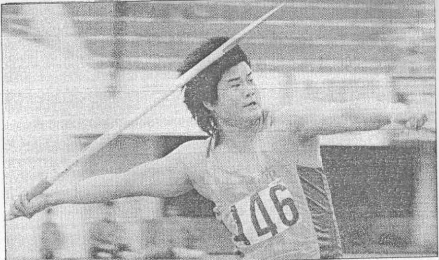
(攝榮豐鍾者記報本)。錄紀運區破打槍標欽明薛市高▲