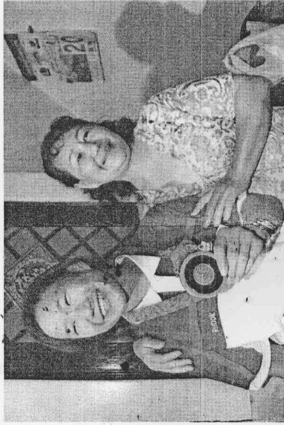
一為台灣勇奪本屆奧運第一面獎牌的陳韋綾(左)，昨天拿出銅牌與媽媽分享喜悅。