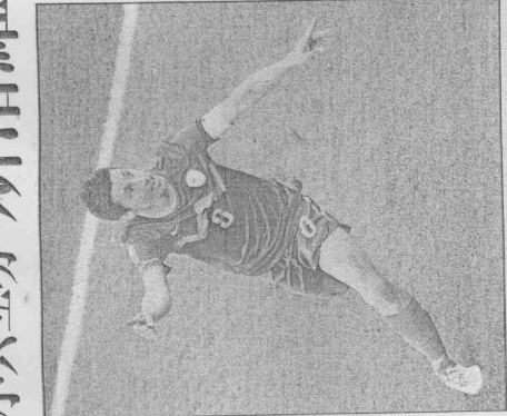
斯洛維尼亞隊隊長科倫在第七十九分鐘把一記赤區起腳機會，成功破網，拿下一球，與賽地比出第一手勢狂。

國家隊在世界杯開幕戰從未輸過，雖然和日本交手3次未嘗勝出，但3次都是在日本本場內對戰，這次到了日本國土，緊要時機會來了。