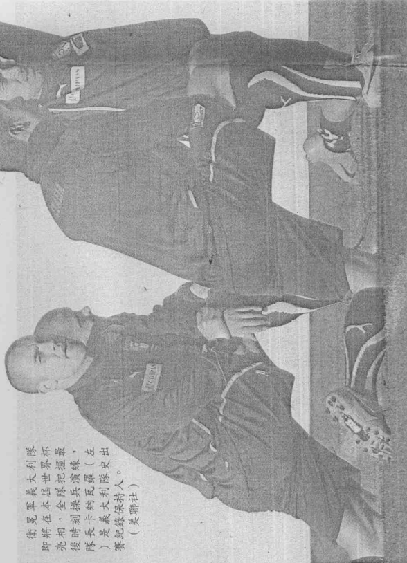
衛冕軍義大利隊 即將在本屆世界盃 亮相，全隊把世盃最 後時刻操兵演練，左 隊長卡納瓦羅（左） 是義大利隊史上 賽紀實保持人。