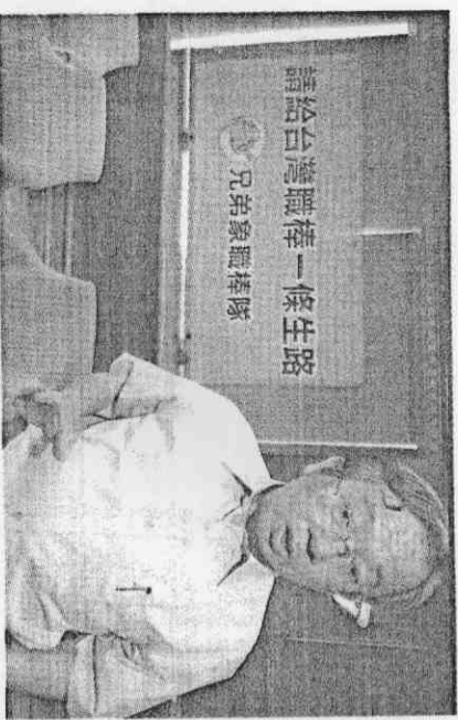
請給台灣職棒一條生路 兄弟象職棒隊

象隊強隊洪瑞河針對球員工會成立沒有表示太多意見，只強調在環境不佳的情況下，有球打比較重要。