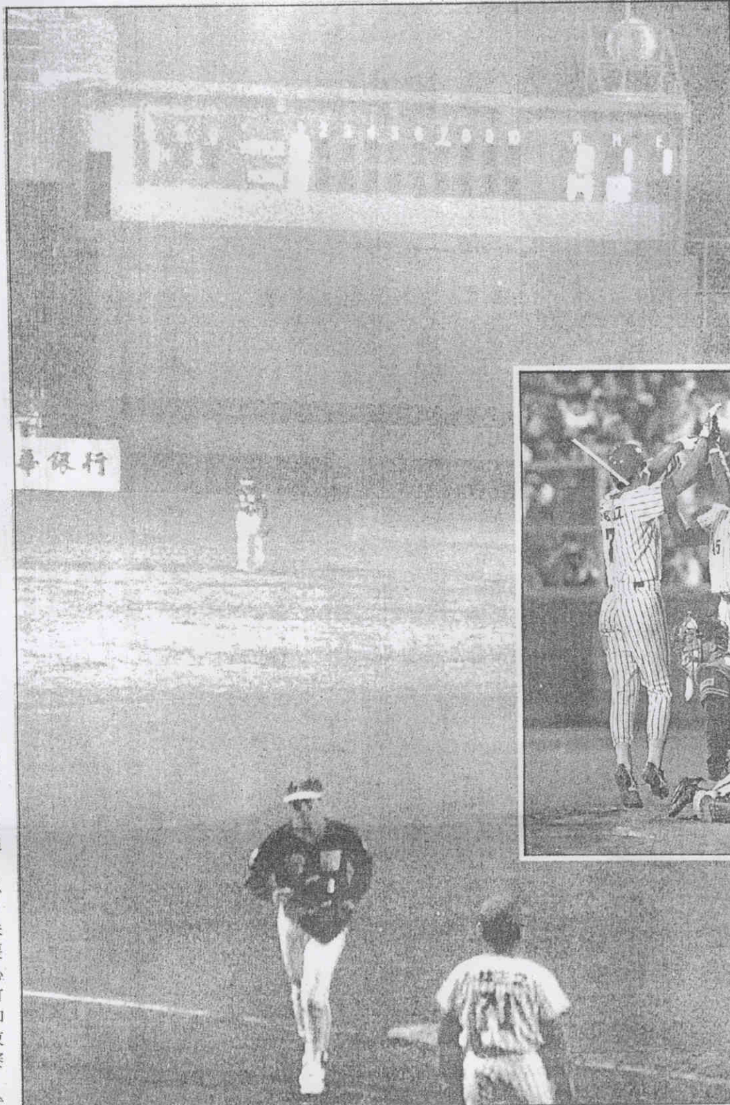
▲第一局結束, 計分板下方的十四分得分, 十二支安打, 都是職棒首見。