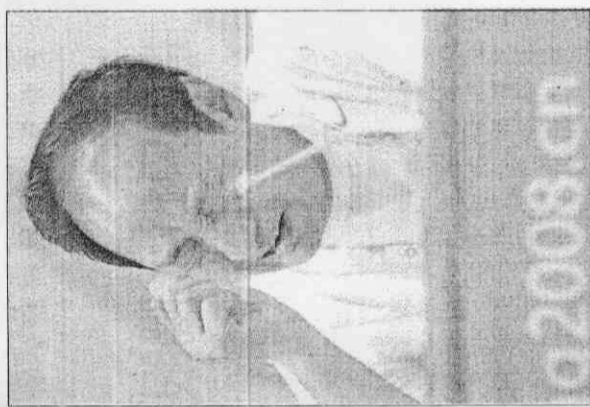
▲劉翔教練孫海平宣布劉翔因傷退賽後泣不成聲。

至於劉翔，他勇於選擇離開的做法，絲毫無損 他在十三億中國人中的地位，甚至還更加崇高 ，就連國際媒體也都以「無限惋惜」、「田徑失 色」來形容劉翔的退賽，對劉翔或中國來說，這 或許也算是種收穫吧！