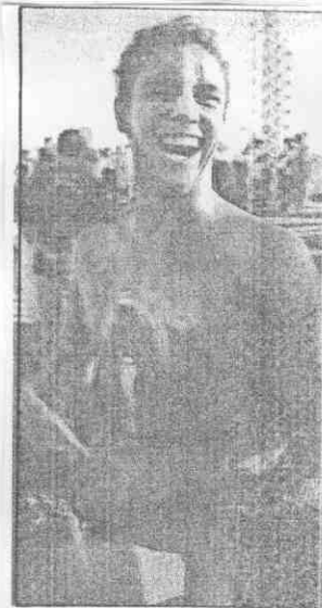
↑巴西長泳選手史貝伯10日在參加25公里長泳前，身上塗滿油脂，以避免伯斯天鵝河中水母的蜇刺。