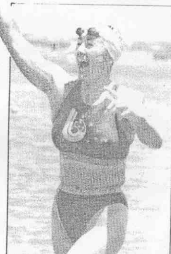
←澳洲女子長泳好手史密絲，10日勇奪25公里長泳金牌。圖為她抵達終點時，興奮地舉臂歡呼。