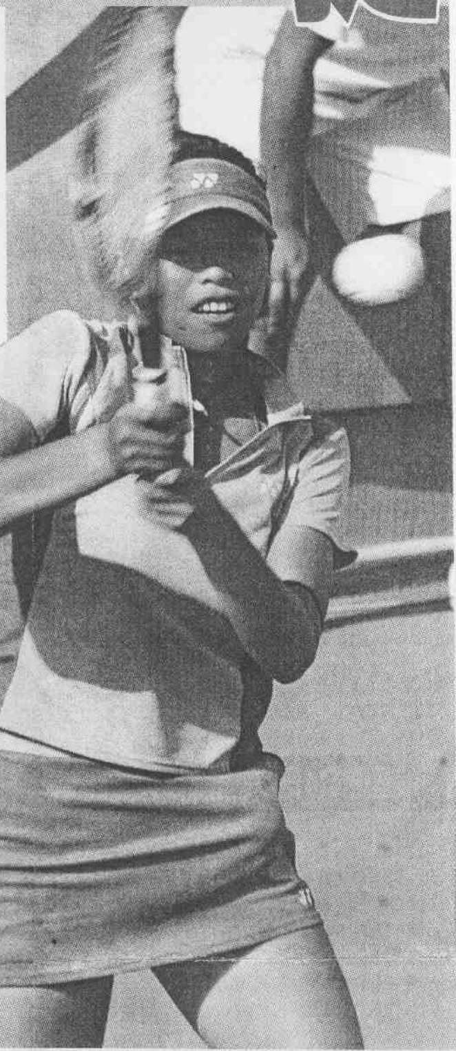
中華女網主將謝淑薇在世大運首輪，過關晉級二輪。