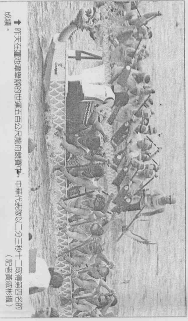
↑昨天在蓮池潭舉辦的世運五百公尺龍舟競賽中，中華代表隊以二分三秒十二取得第四名的成績。

世運輕艇水球賽及龍舟賽於蓮池潭舉行，昨天強風颶風襲擊，吹倒所有服務區臨時搭建帳篷，來自加拿大的薇薇安和瑞妮均在台中教英文，昨天專程南下到高雄參觀世運會賽事，親眼目睹強風吹垮世運會帳篷時，兩人均驚呼「令人害怕！」