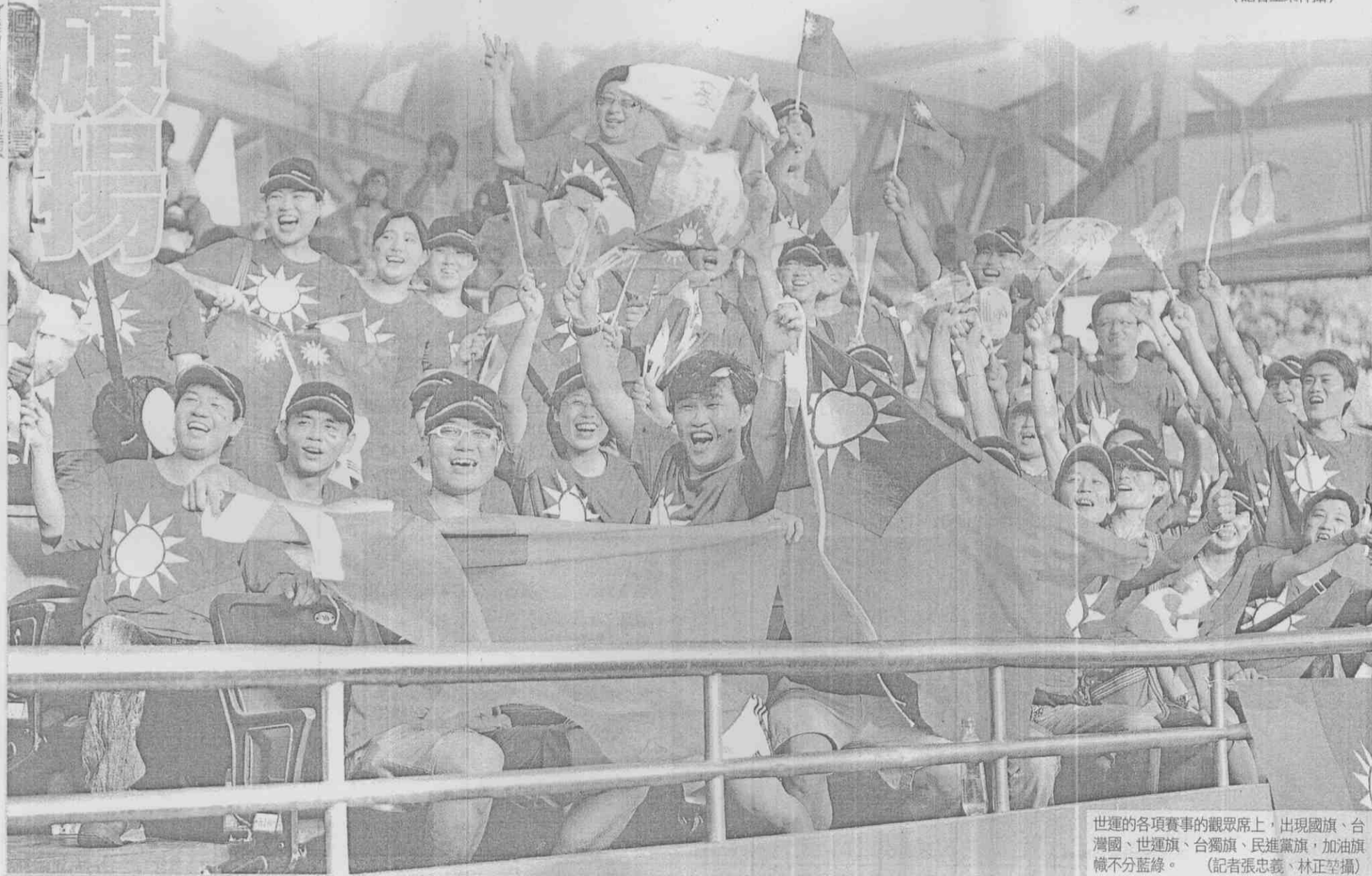
世運的各項賽事的觀眾席上，出現國旗、台灣國、世運旗、台獨旗、民進黨旗，加油旗幟不分藍綠。