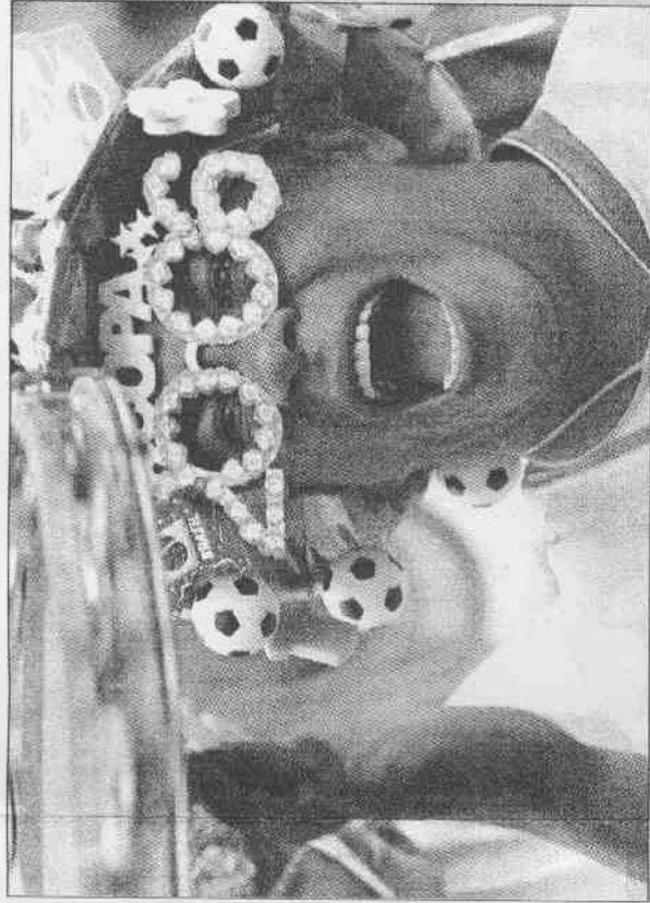
▲巴西愈打行情愈看俏，讓巴西球迷樂不可支。