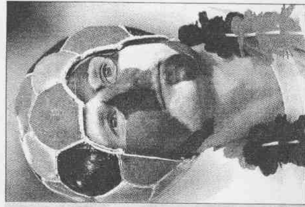
▲一位足球造型球迷靜待澳洲對克羅西亞之戰的到來。