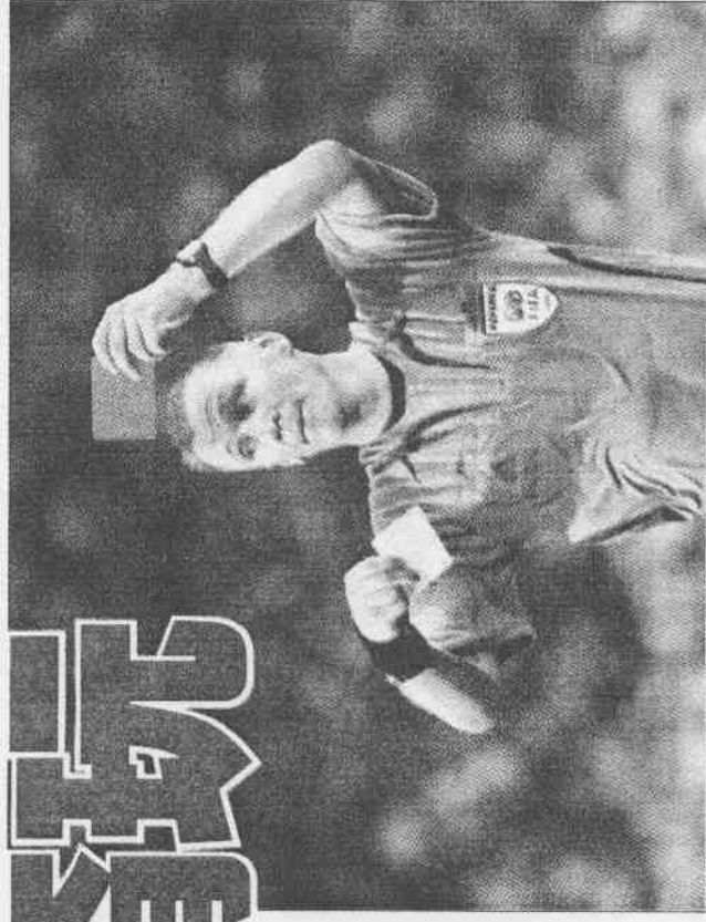
▲世足賽裁判口袋中的紅牌與黃牌，讓球員畏懼三分。